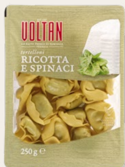
TORTELLONI RICOTTA E SPINACI 250g