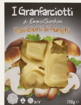
RAVIOLONI FUNGHI 250g