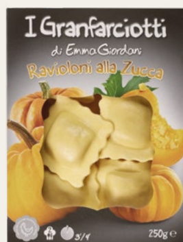
RAVIOLONI ZUCCA 250g