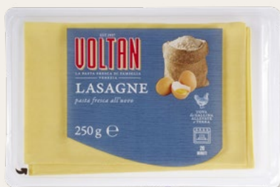
LASAGNE fresche all'uovo 250g