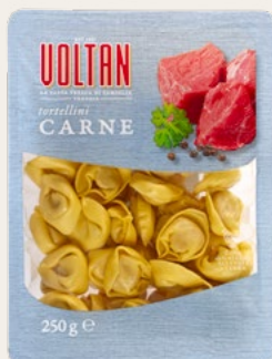
TORTELLINI CARNE 250g