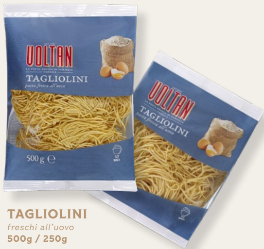
TAGLIOLINI freschi all'uovo 500g / 250g