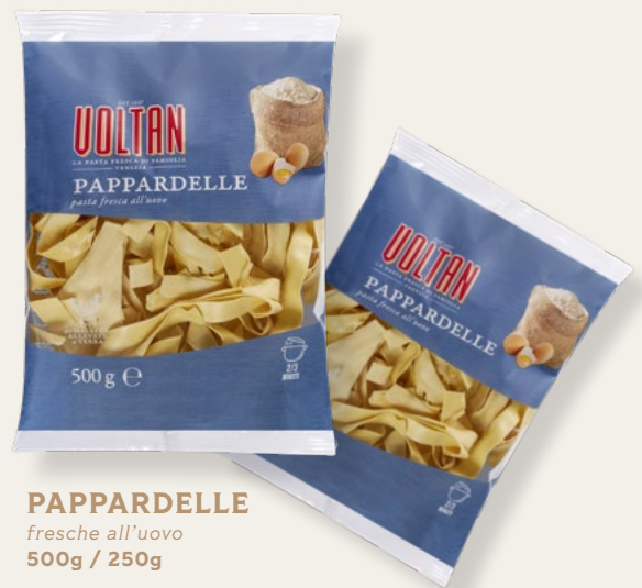
PAPPARDELLE fresche all'uovo 500g / 250g