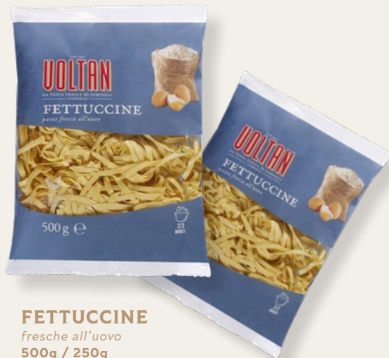
FETTUCCINE fresche all'uovo 500g / 250g