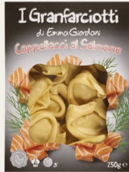
CAPPELLACCI SALMONE 250g