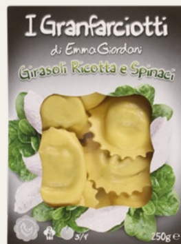
GIRASOLI RICOTTA E SPINACI 250g