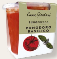
POMODORO E BASILICO 300g