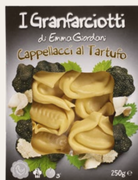
CAPPELLACCI TARTUFO 250g