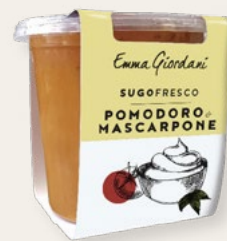
POMODORO E MASCARPONE 300g