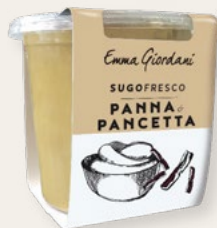
PANNA E PANCETTA 300g