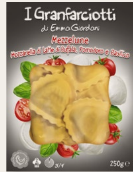
MEZZELUNE POMODORO E MOZZARELLA DI BUFFALA 250g