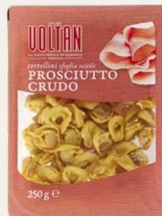
TORTELLINI PROSCIUTTO CRUDO Sfoglia sottile 250g