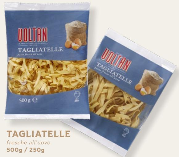
TAGLIATELLE fresche all'uovo 500g / 250g