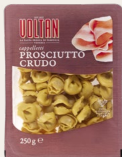
CAPELLETTI PROSCIUTTO CRUDO 250g