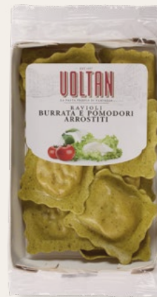
RAVIOLI BURRATA E POMODORI ARROSTITI 250g