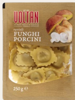
RAVIOLI FUNGHI PORCINI 250g