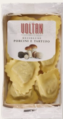
MEZZELUNE PORCINI E TARTUFO 250g