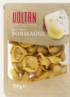
TORTELLONI FORMAGGI 250g