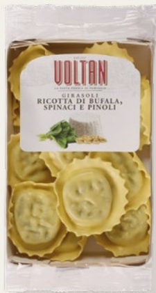
GIRASOLI RICOTTA DI BUFALA, SPINACI E PINOLI 250g