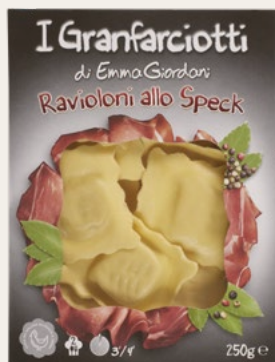
RAVIOLI SPECK 250g