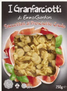
SACCOTTINI PROSCIUTTO CRUDO 250g