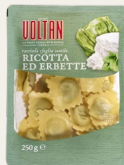
RAVIOLI RICOTTA ED ERBETTE Sfoglia sottile 250g