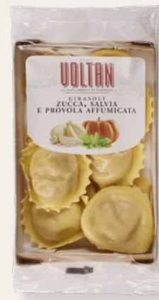
GIRASOLI ZUCCA, SALVIA E PROVOLA AFFUMICATA 250g